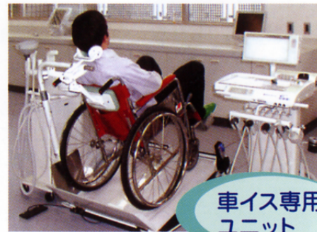
車イス専用 ユニット